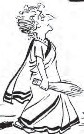
साभार: आर.के. लक्ष्मण, टाइम्स ऑफ़ इंडिया

यह कार्टून 1980 के चुनावों के बाद छपा था।