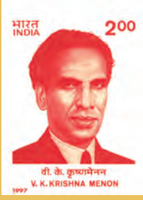
वी.के. कृष्णामेन V. K. KRISHNA MENON

दो भारतीय चौकियों का पतन एक भारतीय हेलिकॉप्टर को मार गिराया चीनियों से अंत तक