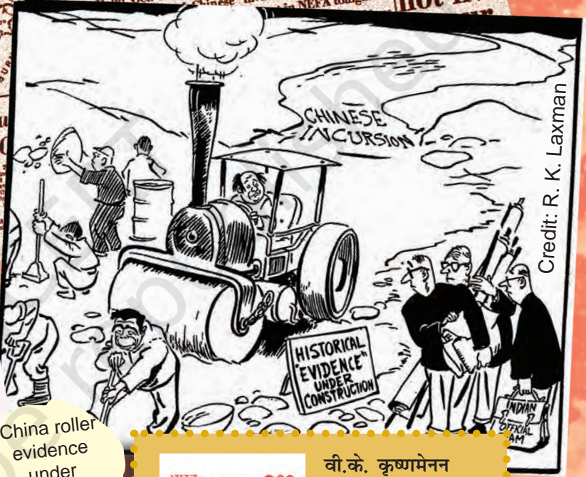
China roller evidence under construction.