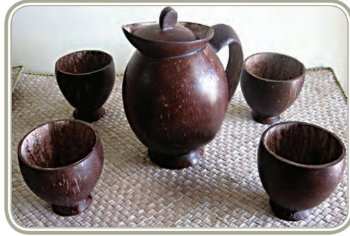
केरल का नारियल शिल्प

जा रहा है। निरक्षरता, सामान्य सामाजिक-आर्थिक पिछड़ापन, भूमि सुधार लागू करने में धीमी प्रगति और पर्याप्त अथवा अकुशल वित्तीय और विपणन सेवाएँ मुख्य बाधाएँ हैं जो प्रगति को बीच में लटका रही हैं। वन-आधारित संसाधनों का कम होना और सामान्य पर्यावरणीय निम्नीकरण, भारत के संदर्भ में, सामने आने वाली विभिन्न समस्याओं के लिए उत्तरदायी है।