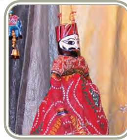
महाराष्ट्र की वाली चित्रकला कठपुतली शिल्प