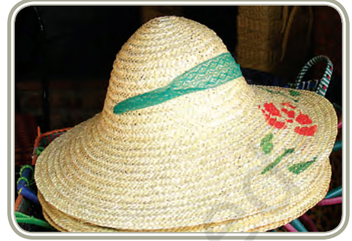
आसाम का बाँस शिल्प

ये सब एक ज़बरदस्त चुनौती सामने लाते हैं और इस देसी ज्ञान, जानकारी तथा कौशलों, जो तेज़ी से अपना आधार खो रहे हैं, के पुनरुद्धार और उसे बनाए रखने की आवश्यकता को इंगित करते हैं। कुछ क्षेत्र जहाँ अंतःक्षेप की आवश्यकता है — नए डिज़ाइन बनाना, संरक्षण और परिष्करण नीतियाँ, पर्यावरण हितैषी कच्चे माल का उपयोग, पैकेजिंग, प्रशिक्षण सुविधाओं की व्यवस्था का संरक्षण और बौद्धिक संपदा अधिकारी (आई.पी.आर.) का रक्षण। आधुनिक युवा और समुदायों के लिए आवश्यक है कि वे व्यक्तिगत रूप से जीविका अवसरों के व्यापक क्षेत्र और संभावनाओं के प्रति जागरूक रहें। इसके अतिरिक्त, ऐसे प्रयास और पहल ग्रामीण जनता की आय-उत्पादन की संभावनाएँ बढ़ाने में बहुत कारगर सिद्ध होंगे। यह नोट करना महत्वपूर्ण होगा कि भारत सरकार इस दिशा में सामूहिक प्रयास कर रही है। समय की माँग और चुनौती के रूप में जिसका भारतीय समाज सामना कर रहा है, वह है — लोकतांत्रिक वातावरण में पदानुक्रम अथवा जाति-आधारित कार्य-विभाजन के बिना विविधता को बनाए रखना।