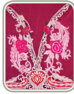
भारत की कशीदाकारी और वस्त्र

भारत में चित्रण कलाओं की विविधता है, जो चार हजार वर्षों से प्रचलन में हैं। ऐतिहासिक दृष्टि से, कलाकारों और शिल्पकारों को दो मुख्य वर्गों के संरक्षकों से सहायता मिलती थी- बड़े हिंदू मंदिर और विभिन्न राज्यों के राजसी शासक। धार्मिक उपासना के संदर्भ में मुख्य चित्रण कलाओं का उदय हुआ। भारत के विभिन्न भागों में वास्तुकला की भिन्न क्षेत्रीय शैलियाँ देखने को मिलती हैं जो विभिन्न धर्मों को प्रतिबिंबित करती हैं, जैसे- इस्लाम, सिक्ख धर्म, जैन धर्म, ईसाई धर्म और हिंदू धर्म। ये सभी धर्म संपूर्ण देश में विशिष्ट रूप से साथ-साथ अस्तित्व में थे। अतः विभिन्न उपासना स्थलों और मकबरे युक्त महलों, समाधि स्थलों, इत्यादि के पत्थरों पर कुशलता से गढ़ी हुई, काँसे या चाँदी में ढाली हुई या टेराकोटा या लकड़ी की बनी हुई अथवा रंगों द्वारा चित्रित कई प्रकार की प्रतिमाएँ देखने को मिलती हैं। इनमें से अधिकांश भारत की विशाल धरोहर के रूप में परिरक्षित की गई हैं। आधुनिक परिदृश्य में, इन कलाओं को सरकार और कुछ गैर-सरकारी संस्थाओं द्वारा संरक्षण और प्रोत्साहन मिला है। इससे उद्यमिता के साथ-साथ रोजगार के अवसर उपलब्ध हुए हैं।