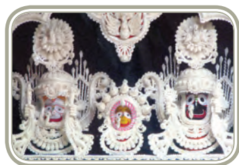
उड़ीसा की शोला शिल्प

सजावट के उद्देश्य से बनाए जाते थे। ये व्यवसाय और कई अन्य, सामाजिक-आर्थिक संस्कृति के आधार को प्रतिबिंबित करते हैं। परंतु आधुनिक अर्थव्यवस्था ने इस प्रकार के शिल्पों की सामग्री को वैश्विक बाजार तक पहुंचाया है जिससे देश को पर्याप्त विदेशी मुद्रा प्राप्त हो रही है।