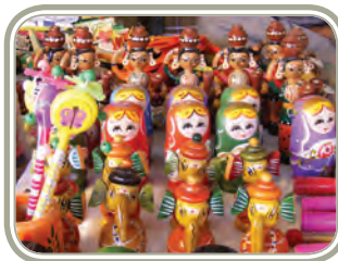
कर्नाटक की चन्नपटन की मूर्तियाँ