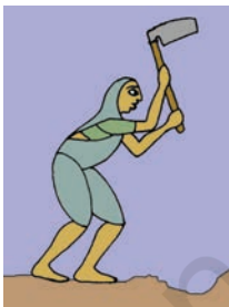
श्रम सभी संपत्तियों का स्रोत है।

उत्खनन सहित कृषि (जिसे प्राथमिक क्षेत्रक भी कहते हैं) और विनिर्माण (जिसे द्वितीयक क्षेत्रक भी कहते हैं), इन दो क्षेत्रकों के बीच उत्पादन-गतिविधियों का विभाजन आर्थिक विकास का संभवतः प्रथम दृष्ट स्वरूप था। यह विभाजन 'श्रम-विभाजन' की प्रक्रिया के माध्यम से हुआ। यह नाम अर्थशास्त्र के जनक एडम स्मिथ द्वारा दिया गया था। इस प्रक्रिया की संक्षिप्त व्याख्या नीचे की गई है।